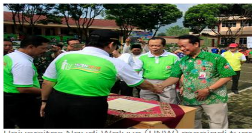
Gambar 1. Univeritas Ngudi Waluyo menjadi Tuan rumah Hari Peduli Sampah Nasional 2018 tingkat Kab. Semarang