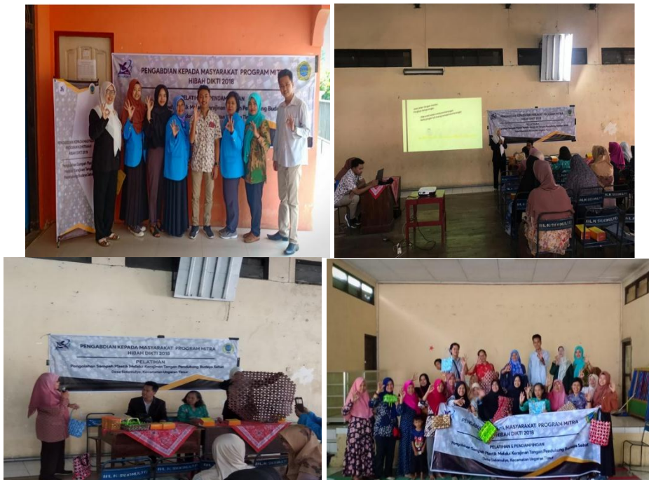
Gambar 8. Tahap Pelatihan