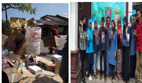
Gambar 3. Pengecekan Ke Bank Sampah Dengan Tim dan Mahasiswa