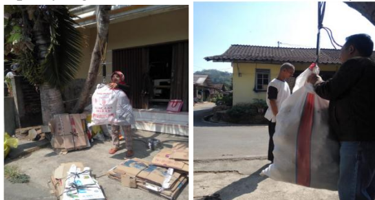
Gambar 4. Proses Pembelian Bahan Olahan Kerajinan