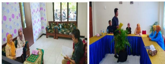
Gambar 2. Rapat Kordinasi Pelaksanaan Kegiatan Dengan Tim dan Mahasiswa