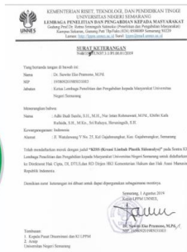
Gambar 9. Merek dagang dengan nama “KISS