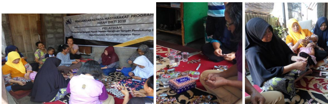
Gambar 10. Proses Pendampingan

merek dagang yang mereka punya sebagai salah satu identitas bagi warga Sidomulyo Kecamatan Ungaran Timur.